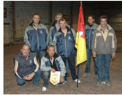
CHAMPIONS de 2 ème Division