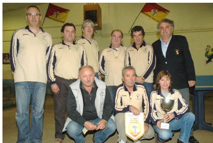
VAINQUEURS de la Coupe d'Aveyron des Clubs